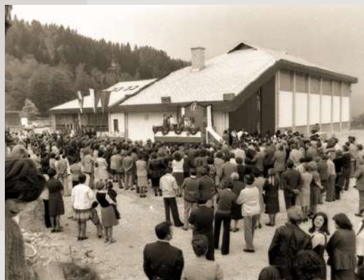
Odprtje nove šole

Slavnostno odprtje nove osnovne šole v Begunjah je potekalo 9. maja 1976. Šola je bila ena prvih v radovljiški občini, zgrajenih v okviru programa razvoja vzgojno-izobraževalnih ustanov s celodnevним poukom, ki so ga prebivalci občine potrdili na referendumu o samopriskpevku.