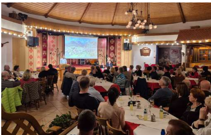
Občni zbor TD